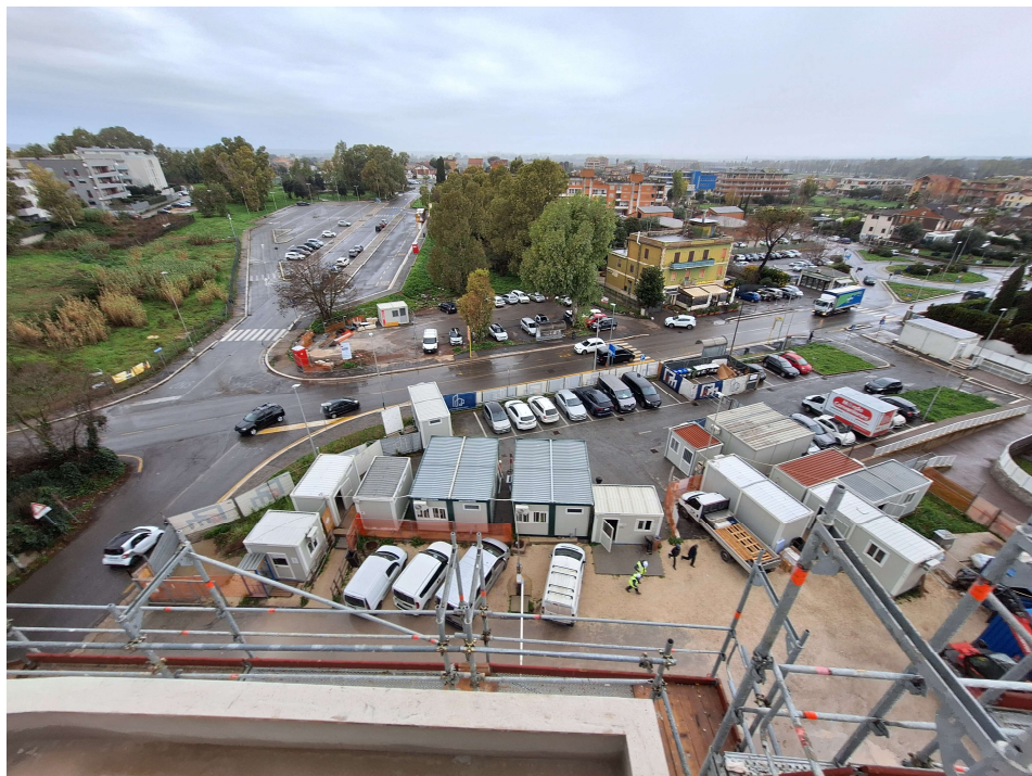
Figura 5: Inquadramento urbanistico dell'area vista dalla Pal. D verso area baraccamenti/parcheggi