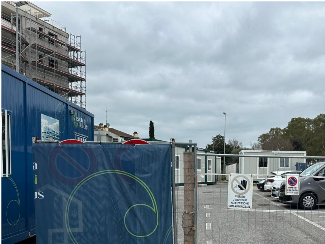
Figura 9: Area di ingresso parcheggio via di Trigoria