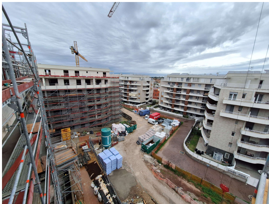
Figura 2 Inquadramento urbanistico dell'area vista dalla Pal. B