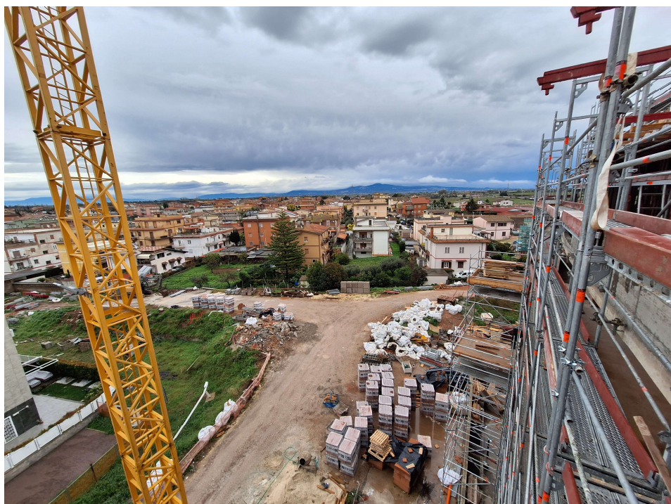
Figura 3 Inquadramento urbanistico dell'area vista dalla Pal. B