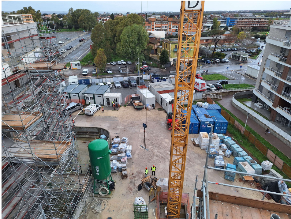
Figura 4: Inquadramento urbanistico dell'area vista dalla Pal. D