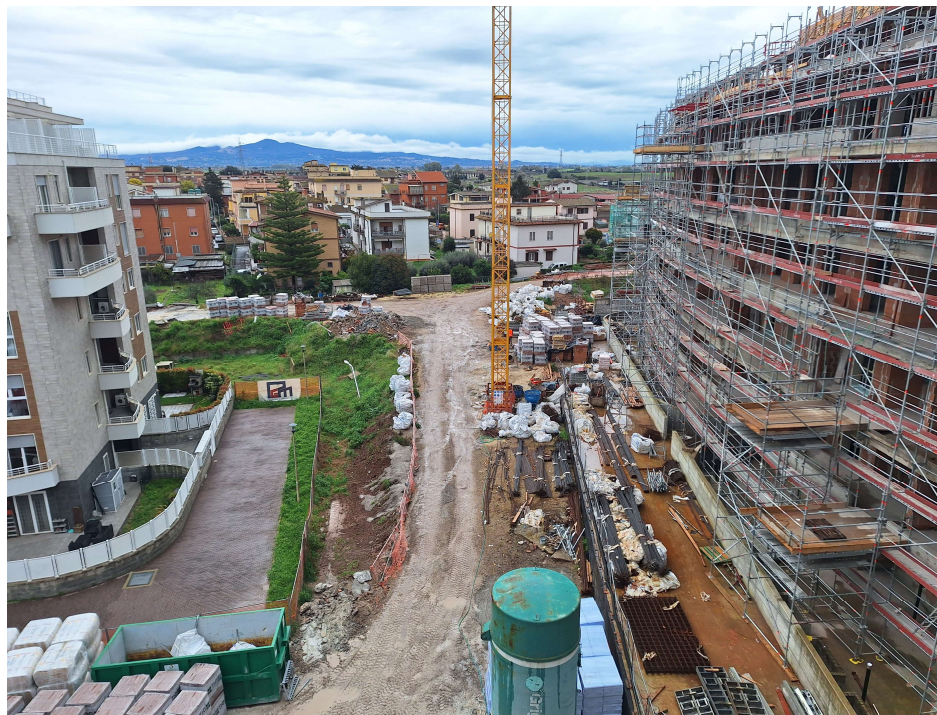
Figura 6: Inquadramento urbanistico dell'area vista dalla pal. D verso Pal. B