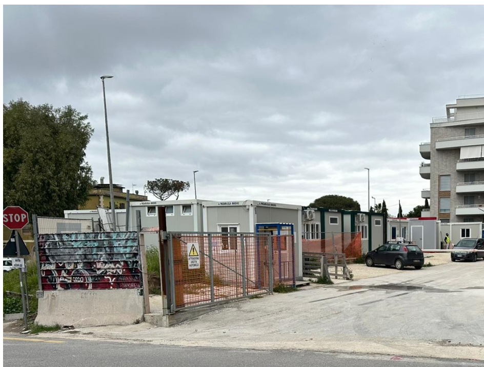
Figura 8: Area di ingresso Via Gian Pietro Talamini – ingresso sud guardiania